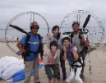
パイロットのお二人と